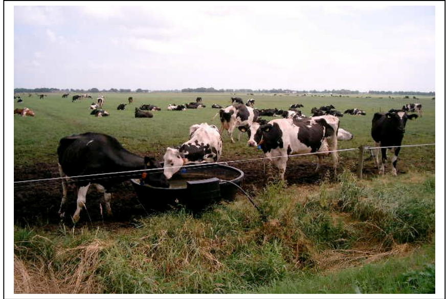
(Tussen Giethoorn en Scheerwolde)

Een poging om lastposten van 't lief te ollen en anhankelijkheid te weren is een gebed zonder ende